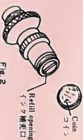
Fig. 2 図2